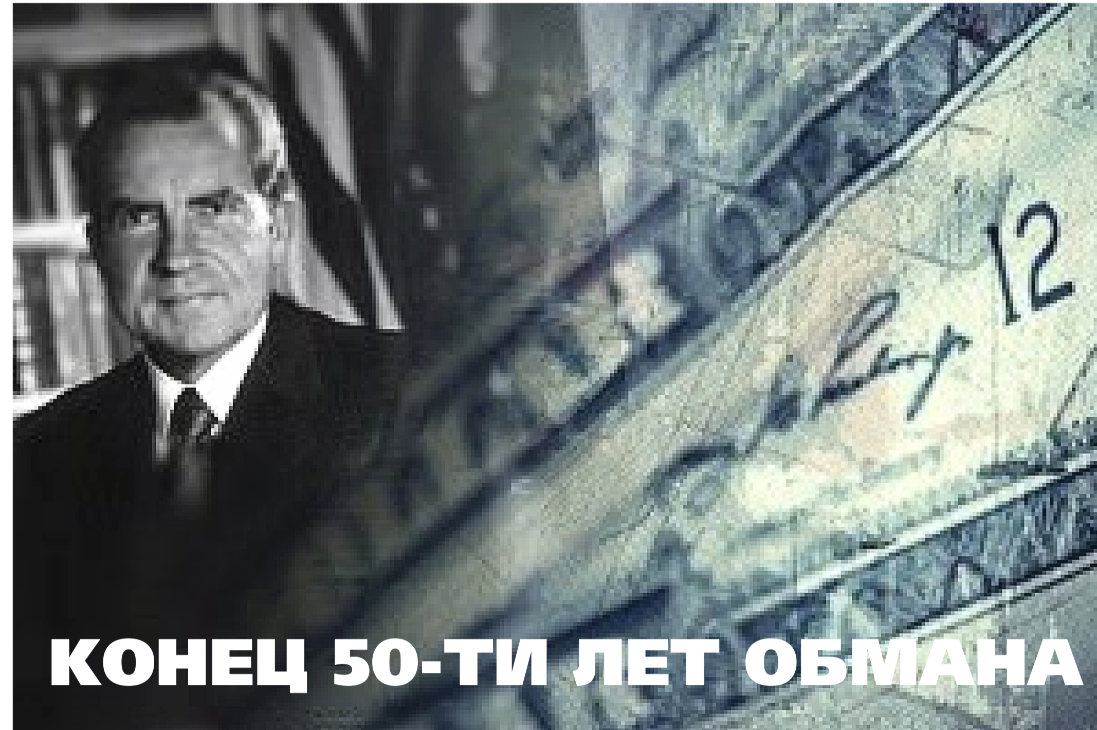
15 августа 1971 года президент США Ричард Никсон объявил о одностороннем отказе США от привязки курса доллара к золоту.

Суверенное Казначейство М1 вынесло свой окончательный вердикт: физическое золото, находящееся на поверхности, в коммерческих банковских хранилищах под кон-